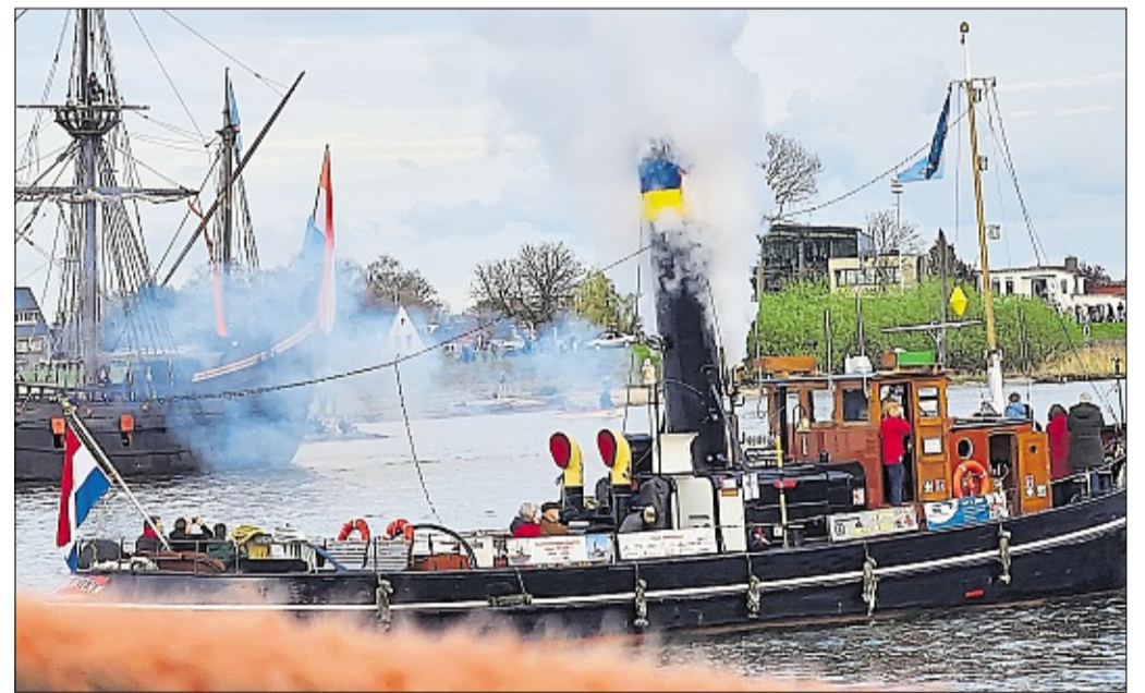
Auch so einige Dampfboote bereicherten bei der Sail 24 die Flottenparade.