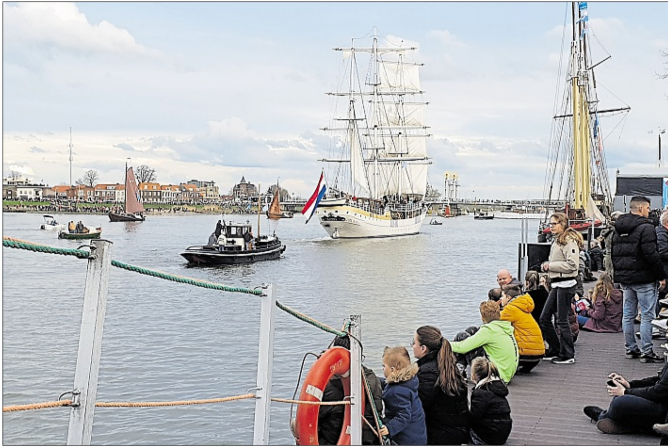
Auf beiden Seiten der Ijssel saßen die Besucher in Kampen, um sich die Flottenschau der historischen Segelschiffe anzusehen.

Viele Auswärtige hatten sich schon frühzeitig Zimmer in einem der örtlichen Hotels reservieren lassen. Wer zum Beispiel im altherwürdigen Boutique-Hotel an Ijsseldijk wohnte, hatte das Geschehen direkt vor der Haustür am idyllischen Ufer der Ijssel. „Wir haben hier die längste Fußgängerzone der Niederlande“, sagt Hotelmanager Jan. Damit meint er die gut gefüllte, lebendige Straße zur anderen Seite des Hotels heraus. Nachgemessen hat keiner seiner Gäste, aber zu bezweifeln ist diese Angabe auch nicht, da die den zu Fuß die Stadt erkundenden Leute vorbehaltene Straße quasi einmal quer durch die ganze Stadt geht. Alleine um die Fußgänger-