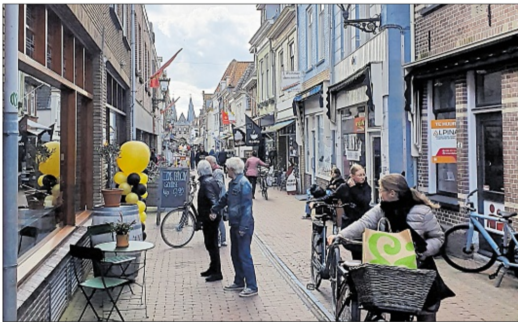
Kampen hat eine der längsten Fußgängerzonen des Landes.