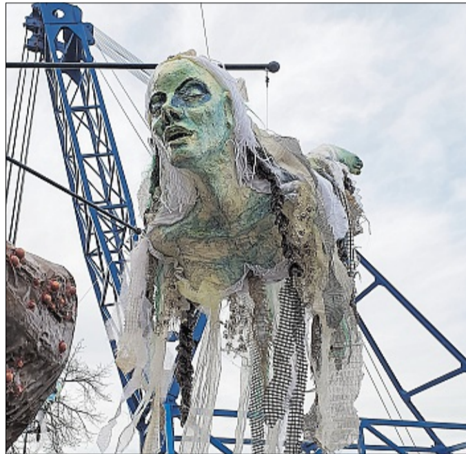
Diverse Schiffsgeister mischten sich unters Volk.

Die Innenstadt von Kampen hat einen der am besten erhaltenen alten Stadtkerne der Niederlande. An vielen Stellen sind Überreste der ursprünglichen Stadtmauer zu sehen. Prunkstücke sind drei historische Stadttore: Koornmarktspoort, Cellebroederspoort und Broederspoort. Das Stadtbild bestimmen keine Hochhäuser, sondern Kirchen, Tore, historische Bauten, Denkmäler und Skulpturen. Begrüßt werden Kampen-Besucher, die aus Richtung Deutschland kommen, mit der wunderschönen Stadsbrug, der Stadtbrücke mit ihren goldenen Rädern in der Mitte. Diese sehen nicht nur gut aus, sie funktionieren auch und sorgen dafür, dass das Mittelteil der Brücke hochgeklappt werden kann, um große Schiffe passieren lassen zu können. Die Leute, die die alte Hansestadt noch nicht