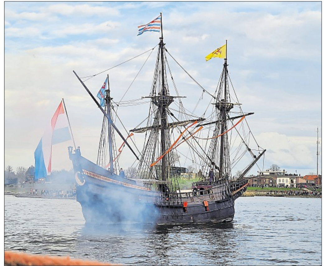
Kanonenschüsse mit anschließender Pulverwolke gehörten stilecht dazu.

Weitere Infos unter www.holland-hanse.de